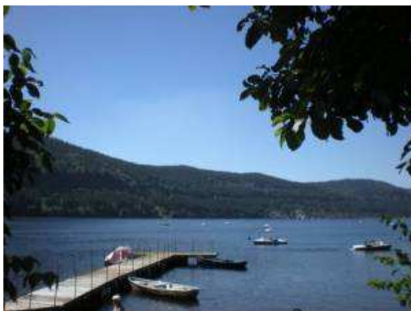
jezero Tittisee ve Schwarzwaldu-místo stáže

Jsem ráda, že mohu vybírat zájemce nejen mezi žáky z oborů s maturitní zkouškou, ale i mezi žáky z oborů s výučním listem.