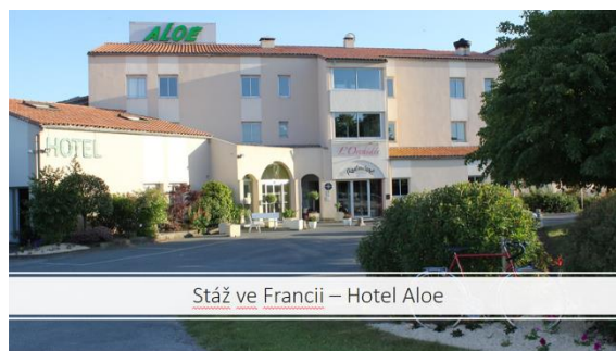
Stáž ve Francii – Hotel Aloe

Pracovali a byli ubytováni v hotelu Áloe v nedalekém městě Les Herbiens. V průběhu